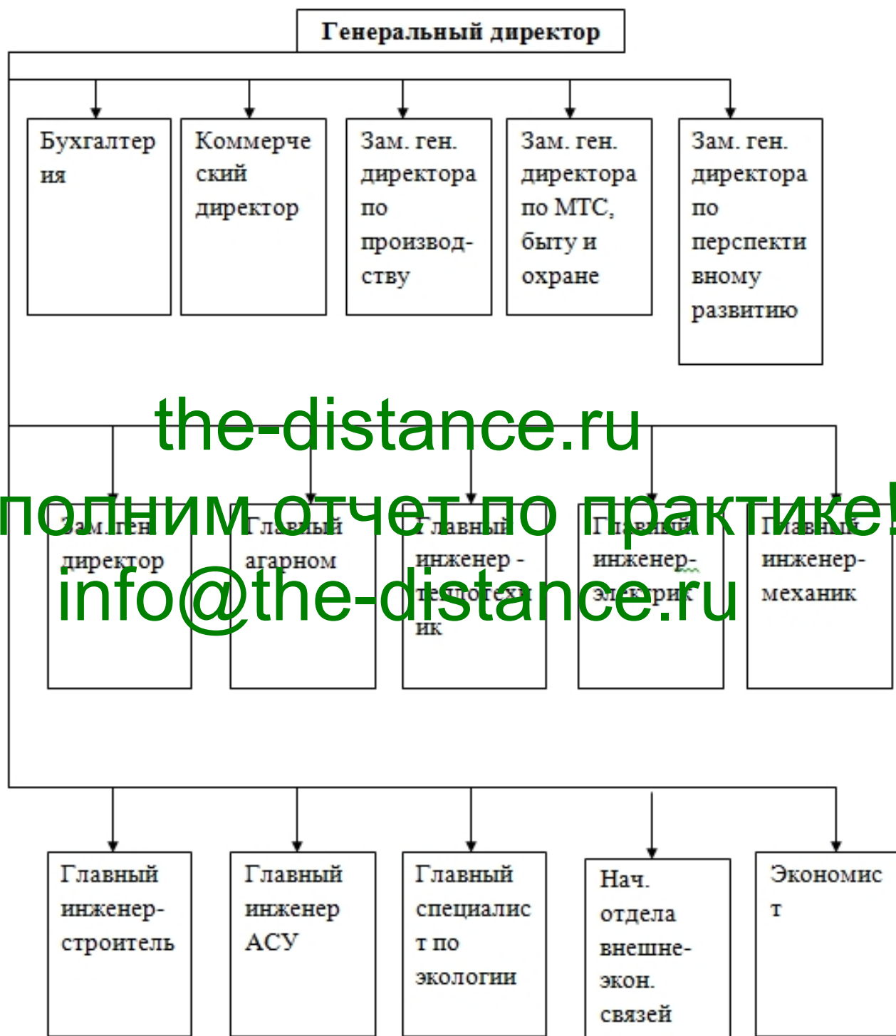
Рисунок 2.1 - Структура управления ООО «Бина-Агро Трейдинг»

Структура управления ООО «Бина-Агро Трейдинг» изображена на рисунке 2.1.