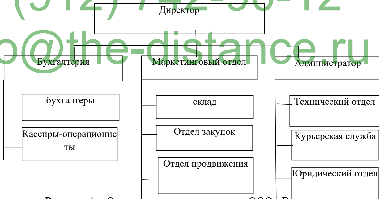
Рисунок 1 – Организационная структура ООО «Виктория»

Возглавляет ООО «Виктория» директор предприятия (рисунок 1).